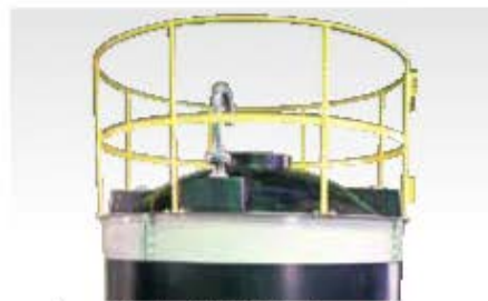
ULタンクなど(補強枠なし)