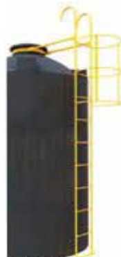
本体装着型 プロテクター付