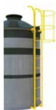
補強枠装着型 プロテクター付