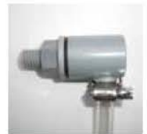
液面計 PVC製エルボ及び透明ホース。