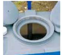
マンホール 中栓式二重蓋のため輸送中の液もれがありません。