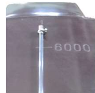
チューブ式液面計