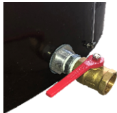
65Aアルミフィッティング・ レバー式ボールバルブ付