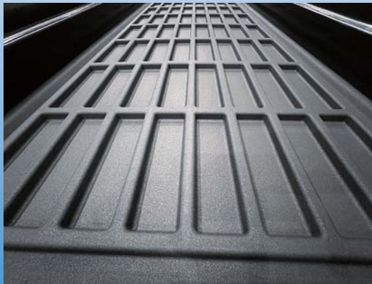
歩行面防滑仕上げ