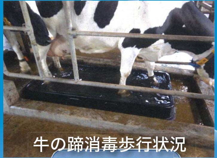
牛の蹄消毒歩行状況