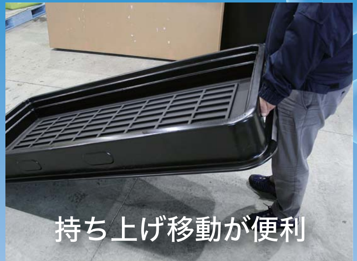
持ち上げ移動が便利